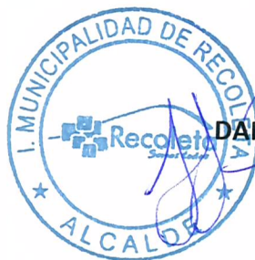
DANIEL JADUE JADUE ALCALDE